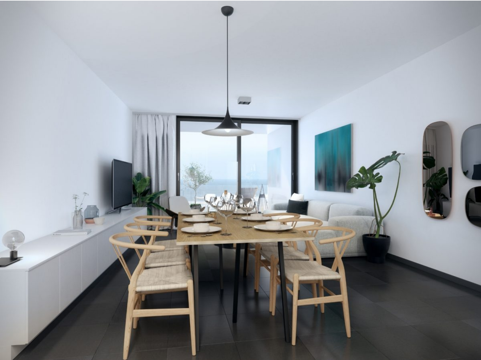
Residentie Samoun D'or - B201