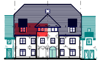
GEVEL / FAÇADE