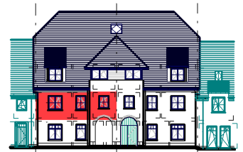
GEVEL / FAÇADE