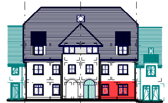
GEVEL / FAÇADE