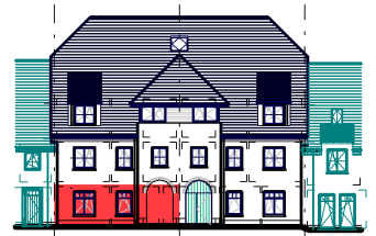
GEVEL / FAÇADE