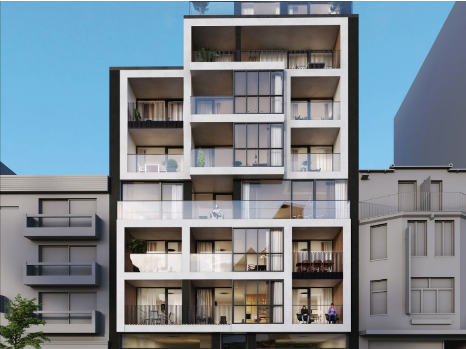
Residentie Morgenster/Saumon d'Or - A401