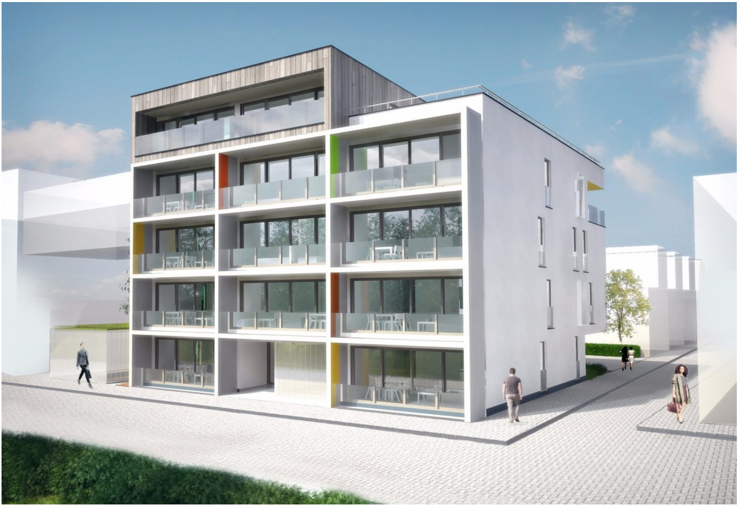
Residentie Poseidon - A102