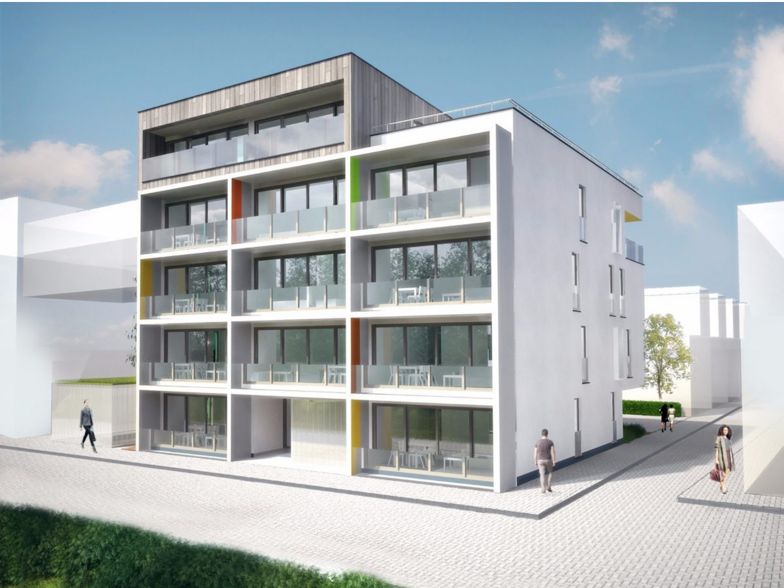
Residentie Poseidon - A102