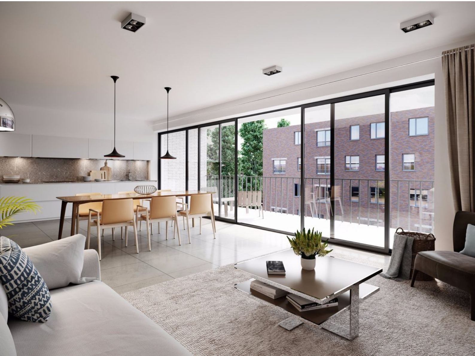
Residentie Kaaiken - C101