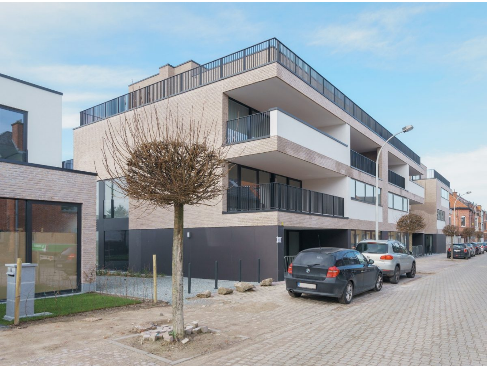
Fortuna - D01