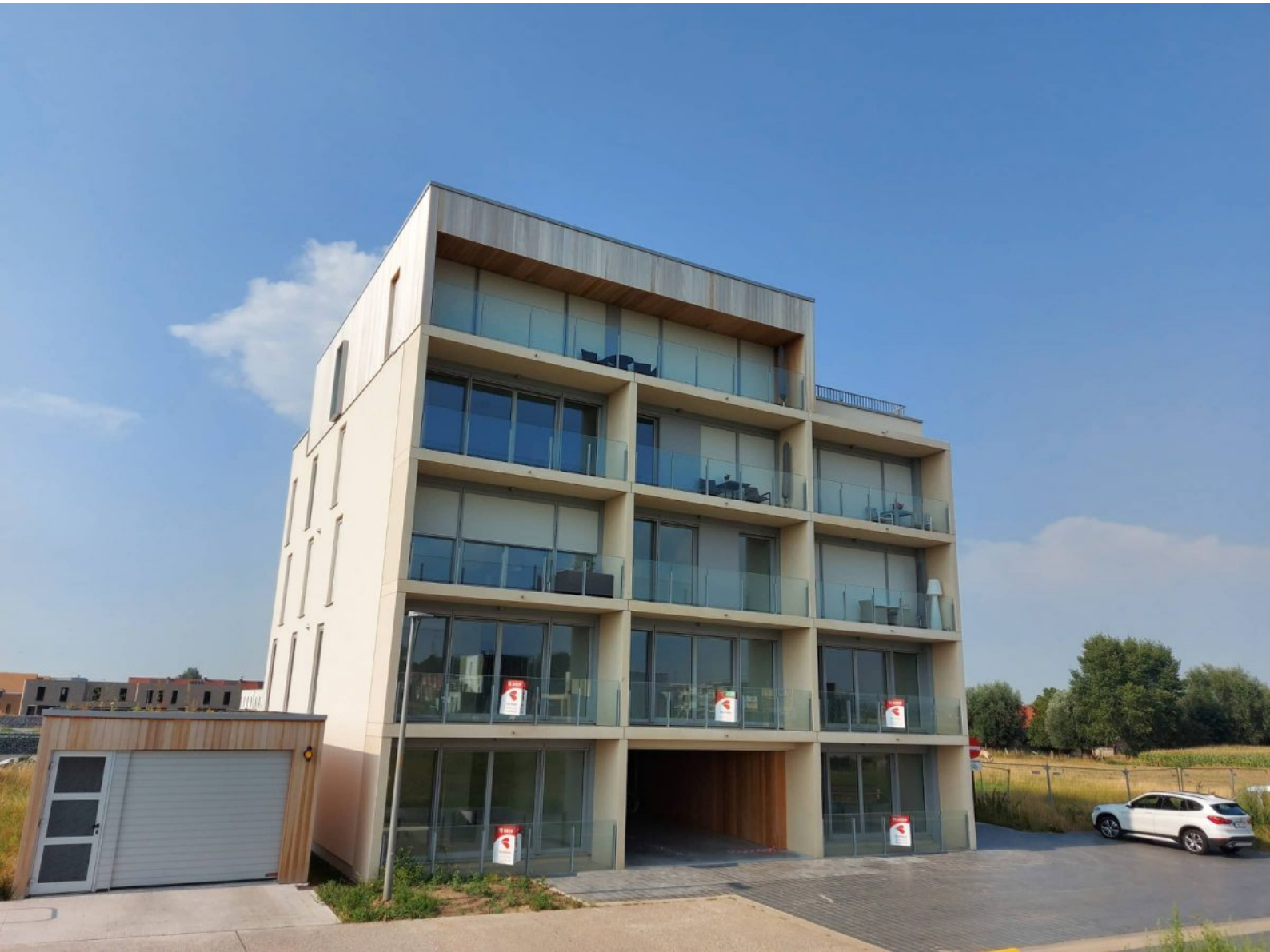
Residentie Poseidon - A102