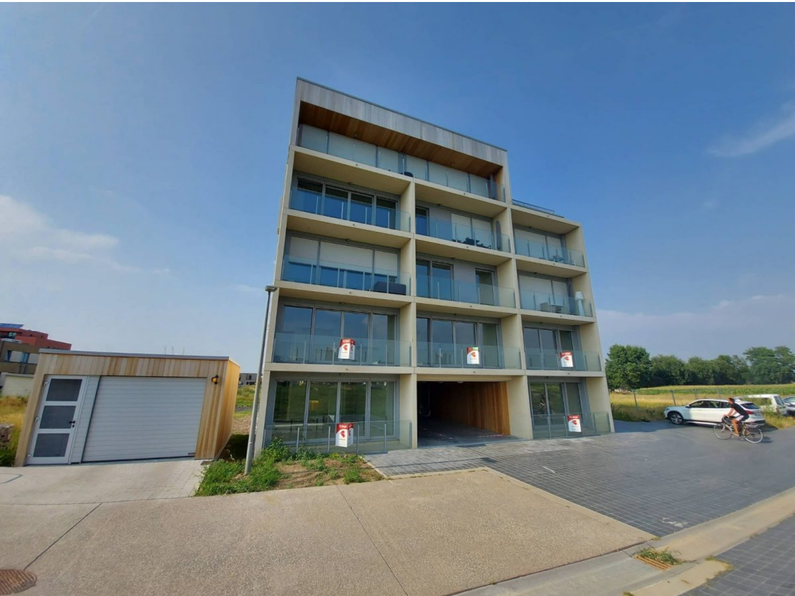
Residentie Poseidon - A002