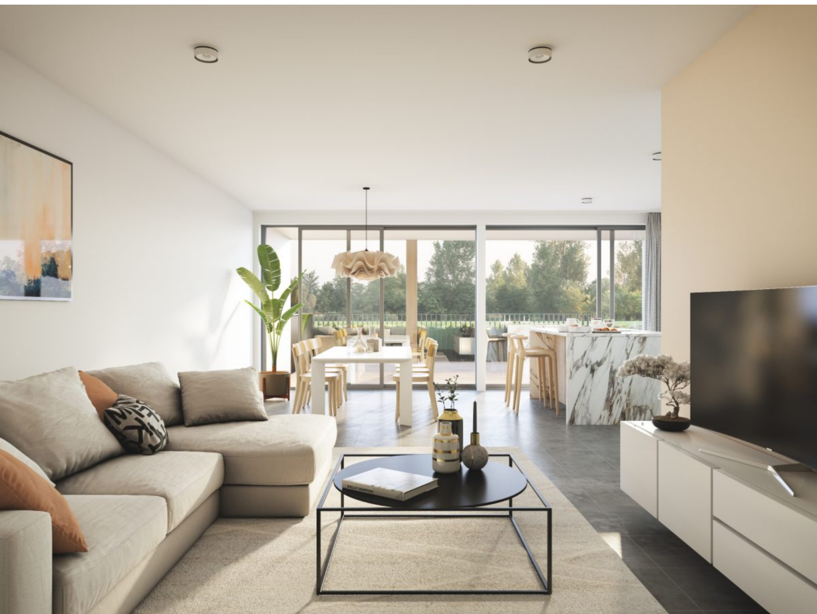
Residentie Koningsstern - D002